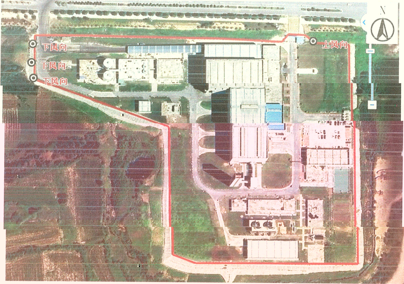
附件 2: 采样点位图